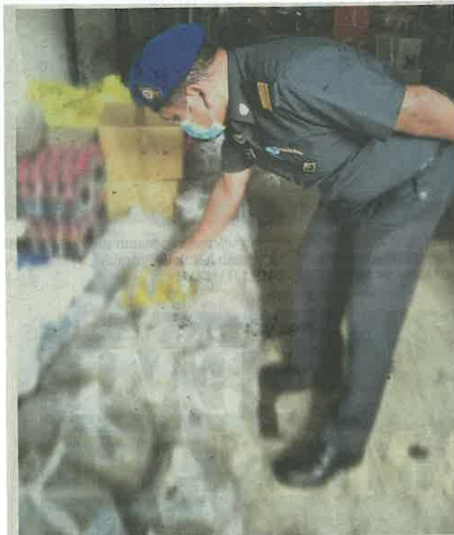
ANGGOTA penguat kuasa KPDNHEP Pulau Pinang memeriksa minyak masak bersubsidi yang dirampas.