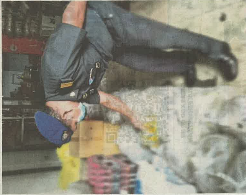
Penguat kuasa KPDNHEP Pulau Pinang memeriksa minyak masak satu kilogram bersubsidi dalam sebuah stor tidak berlesen di Bukit Mertajam, semalam.

Serbuhan di stor simpanan tidak berlesen selepas terima aduan masalah bekalan